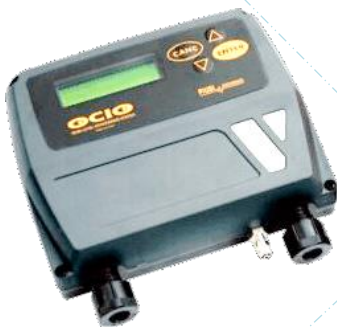
Opción indicador aforo autónomo