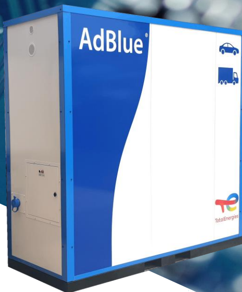
Ejemplo de personalización